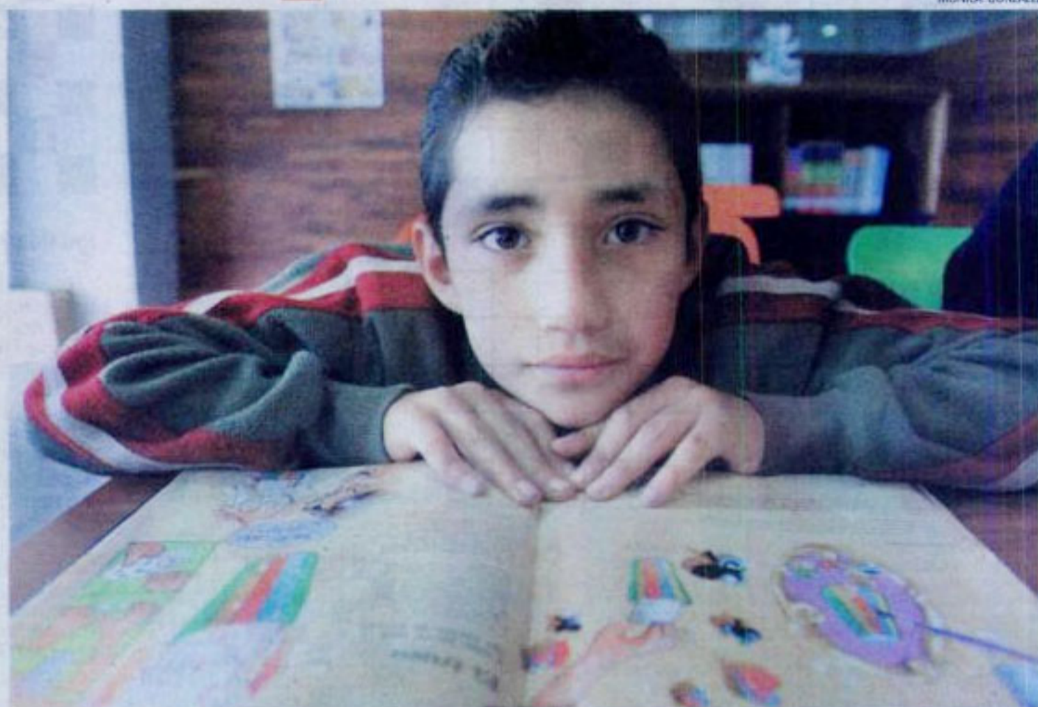
Alrededor de 50 por ciento de usuarios tiene una percepción positiva de éstas